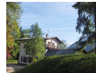
CHALET FLEUR DES NEIGES Station de St Gervais - Haute Savoie Altitude : 930 m